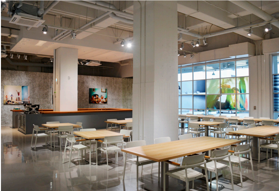
Las habitaciones en el «PORT» son inusualmente espaciaosas y diáfanas para los estándares urbanos de Tokio, con una suntuosa decoración interior.

y oficinas. amana también suministra impresiones fotográficas XL para exposiciones y eventos. Sasaki explica cómo las imágenes producidas por la tecnología de inyección de tinta tienden a ser granuladas. «Pero no con Nyala», afirma. Además de CMYK, la impresora está equipada con magenta claro, cian claro y negro claro. El uso de colores claros ayuda a sacar los gradientes más suaves y los tonos más finos. Además, amana tenía su Nyala equipada con blanco y barniz, así como con la opción de rollo a rollo. Por lo tanto, pueden procesar cualquier material y crear efectos especiales, lo que de nuevo está en línea con su enfoque artístico. Los soportes más utilizados van desde metacrilato, lonas y papel hasta lienzos y textiles backlit. Por supuesto, el equipo está siempre